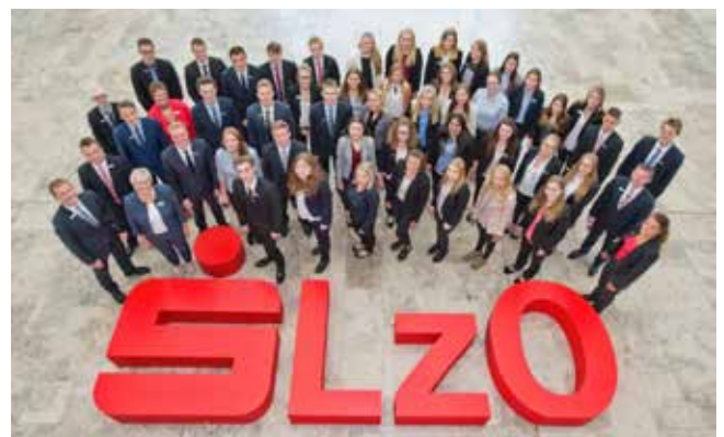
Die Mitarbeiter stehen in 113 Filialen für Bankgeschäfte zur Verfügung.

Die Landessparkasse zu Oldenburg (LZO) ist eine Sparkasse mit 86 personenbesetzten Filialen. Zusätzlich werden 27 SB-Filialen betrieben. Das Geschäftsgebiet erstreckt sich von Wangerooge bis Damme und von Ramsloh bis Delmenhorst. Die Bilanzsumme beträgt ca. 9,5