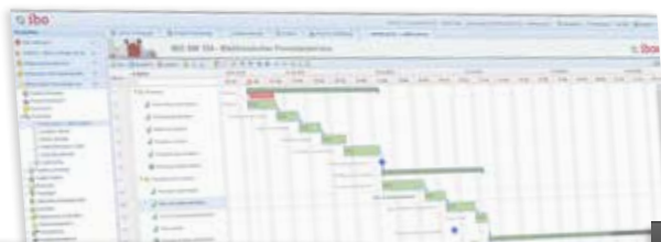
Projekte klassisch planen...